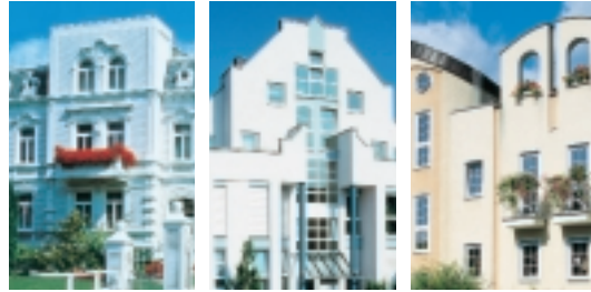
Klasik – marjinal – coşkulu. VEKA sistem çizgilerinin çok yönlü dizaynları.

Her gün yaşam alanımızı şekillendiririz. Bazen bilinçli bazen de bilinçsiz olarak. Örneğin evimizi döşerken yada sadece büromuza bir takvim asarken veya çalışma masamızı yeniden düzeltirken bile şekillendiririz. Kendimizi bile sürekli yeniden «tasarlarız». Bugün hangi ceketi giyeyim? Bu kazak bu çoraplara uygun mu? Saç modelim hâlâ hoşuma gidiyor mu gibi sorulara sürekli olarak şekiller ve formlar üzerine kararlar verir, seçer, değiştirir ve kendimize özel bir hayat stili yaratmak için çabalarız.